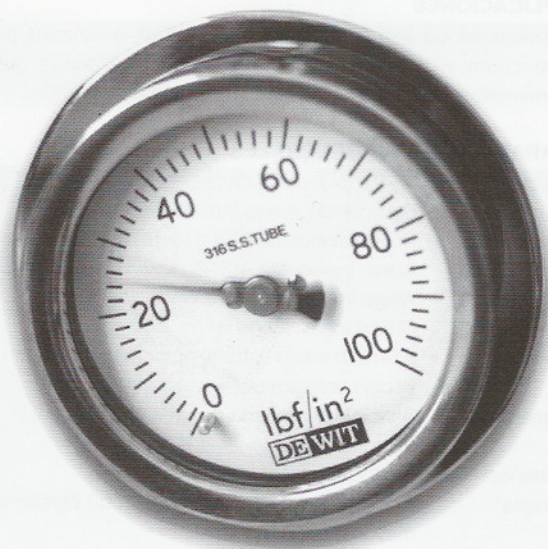
Sin mecanismo "vibragauge"®